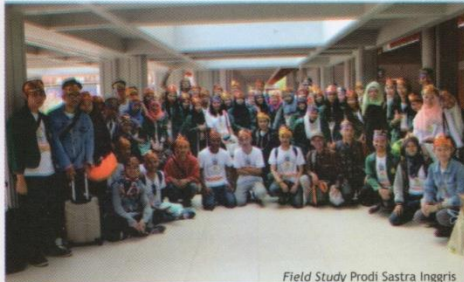
Field Study Prodi Sastra Inggris