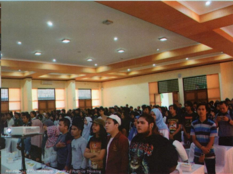
Mahasiswa FISS Workshop Dasar Positive Thinking